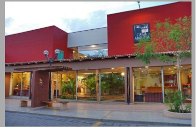
Photos de chambres non contractuelles